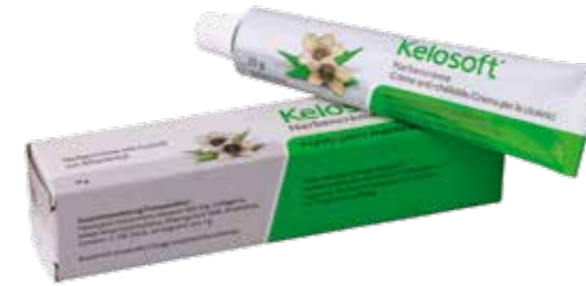
Kelosoft® Creme zur Narbenbehandlung