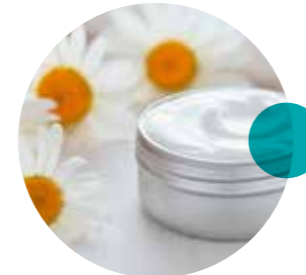
Salben mit Extrakten