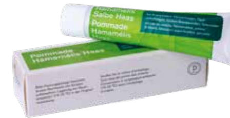
Hamamelis Salbe Salbe zur Wundbehandlung