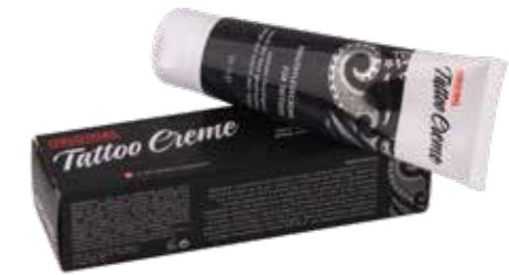
Tattoo Creme Pflege für tätowierte Haut