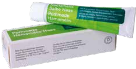
Pommade à l'hamamélis Pommade pour le traitement des plaies