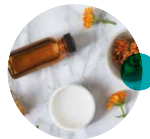
Pommades aux huiles essentielles