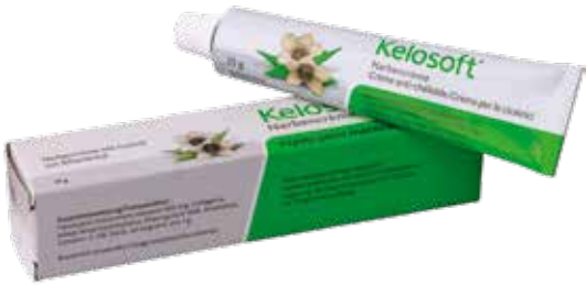
Kelosoft® Crème pour le traitement des cicatrices