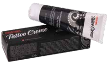
Tattoo Creme Soin pour peau tatouée